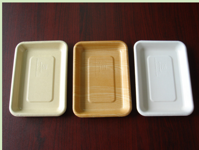
Film polyéthylène (à utiliser sous certaines conditions).